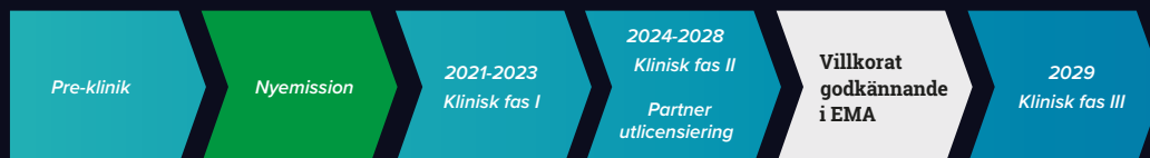
Tidslinje för SI-053 utveckling