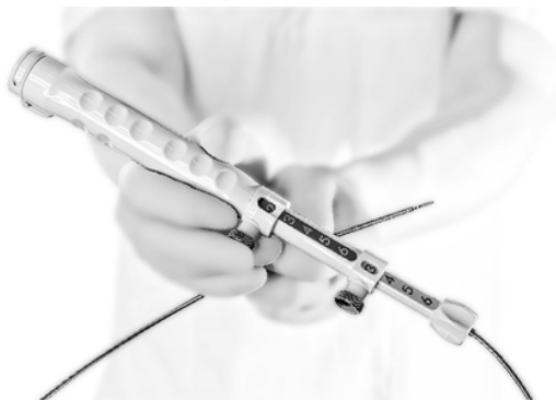
EndoDrill® Model X – ett unikt eldrivet biopsiinstrument

Under andra och tredje kvartalet arbetade vi febrilt med att förbereda oss inför multicenterstudien EDMX01 genom att tillverka en klinisk serie av EndoDrill® Model X-instrument och inhämta regulatoriska tillstånd från Etikprövningsmyndigheten och Läkemedelsverket. Vi genomförde även obligatoriska studieförberedelser med kliniskt ansvariga på respektive studieort. Samtidigt förstärktes IP-portföljen för EndoDrill® Model X genom inlämnade av ännu en internationell patentansökan (PCT). Efter rapportperioden, i april 2021, lämnade vi in ytterligare en PCT-ansökan, vilket innebär att Bolaget nu har en europeisk och tre internationella patentansökningar under behandling (patent pending).