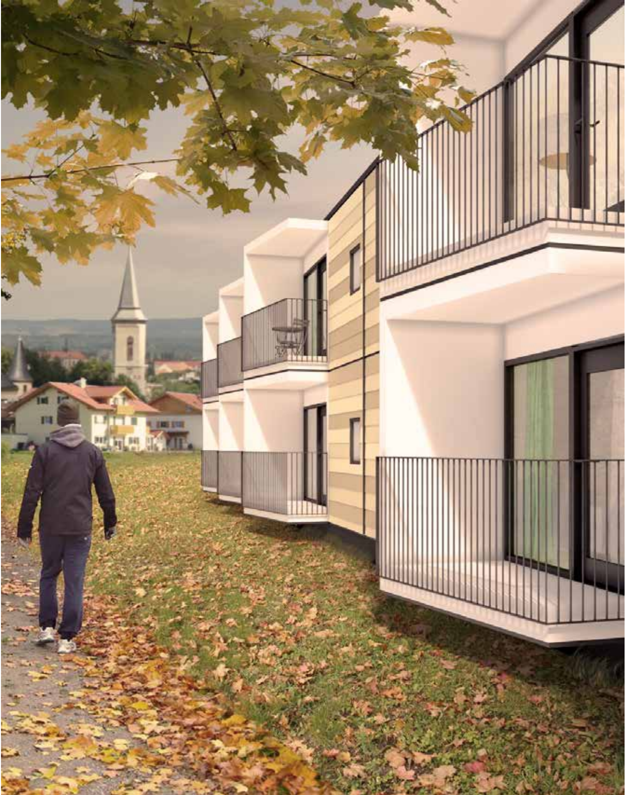
Exteriör av en typ av boende med små energieffektiva lägenheter som Zenergy utvecklar för lansering april 2016.