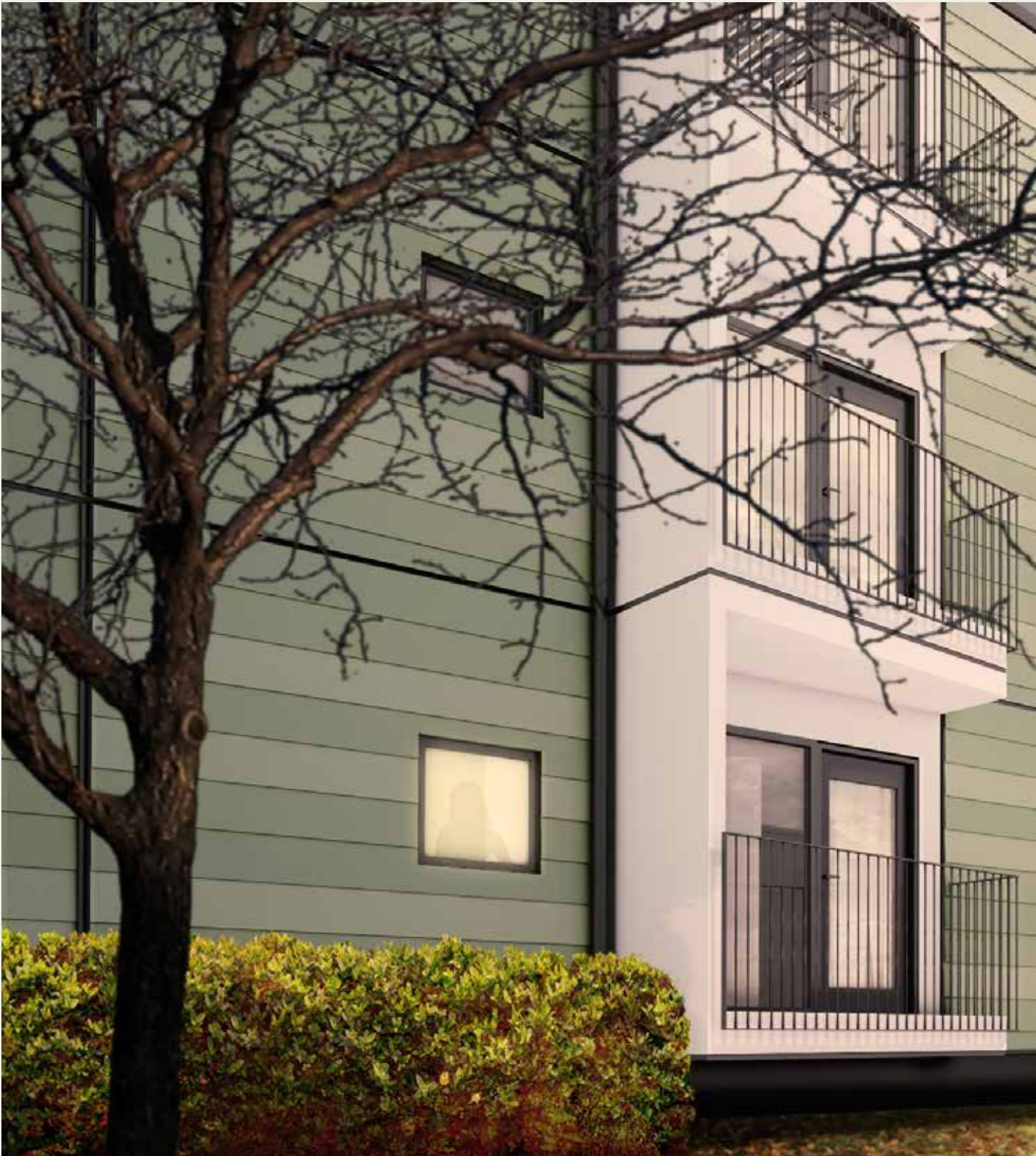
Exteriör till en typ av boende med små energieffektiva lägenheter som Zenergy utvecklar för lansering april 2016.