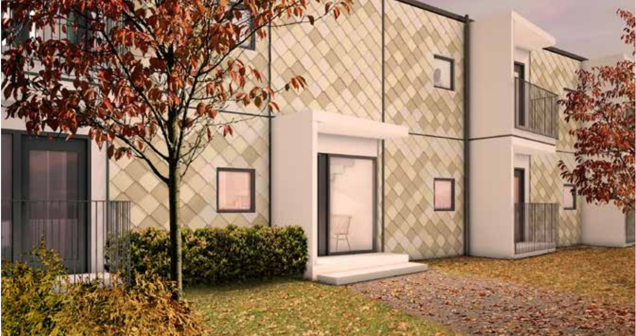
En variant av entré till boende med små energieffektiva lägenheter som Zenergy utvecklar för lansering april 2016.

Sandwichelement är kostnadseffektiva prefabricerade paneler som består av två lager förlackerade stålplåtar med en inre isoleringskärna emellan. Isoleringsmaterialet som används är en brandklassad mineralull eller polyuretanskum.