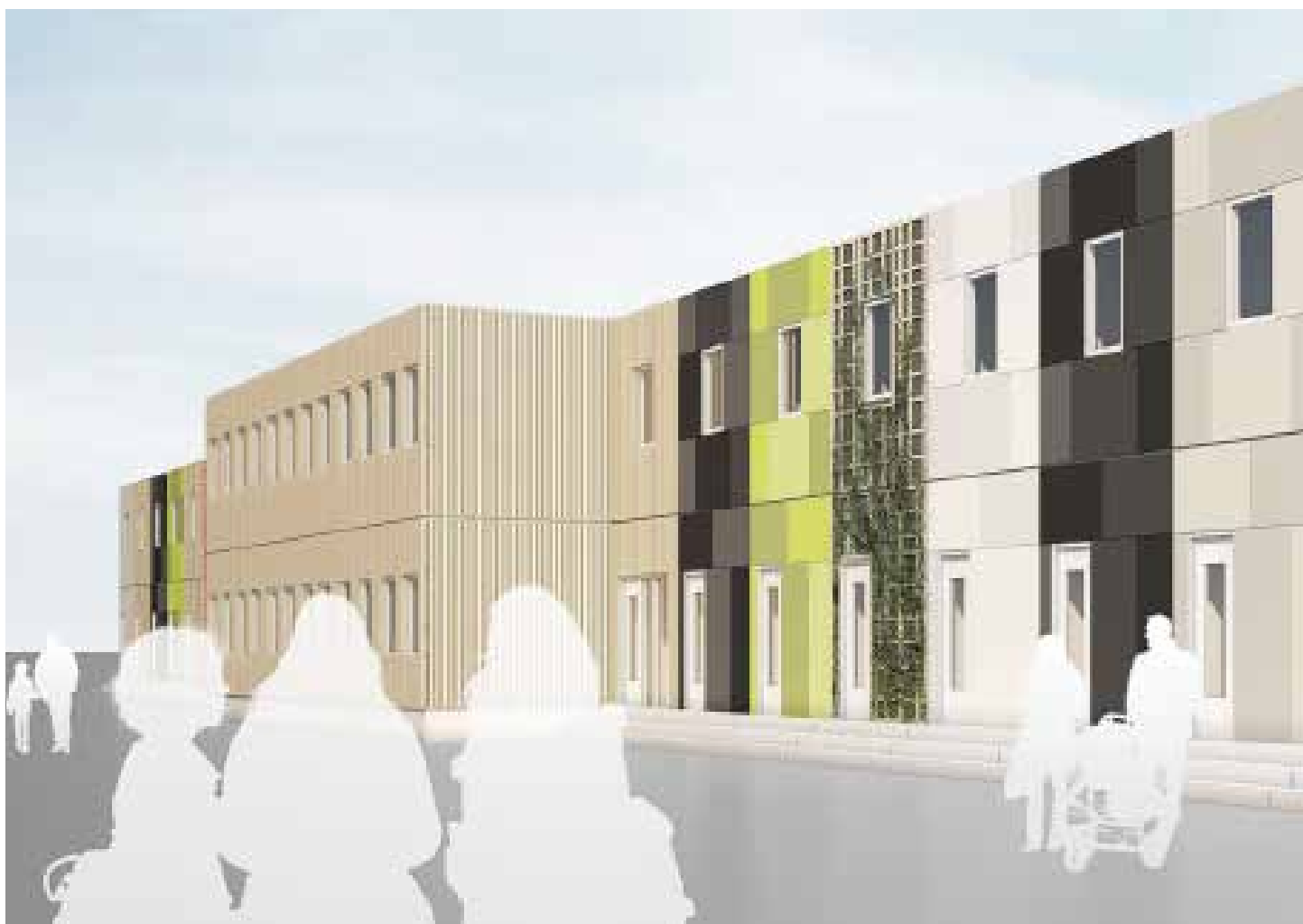
Ett förslag till asylboende utarbetat på förfrågan från en kund.