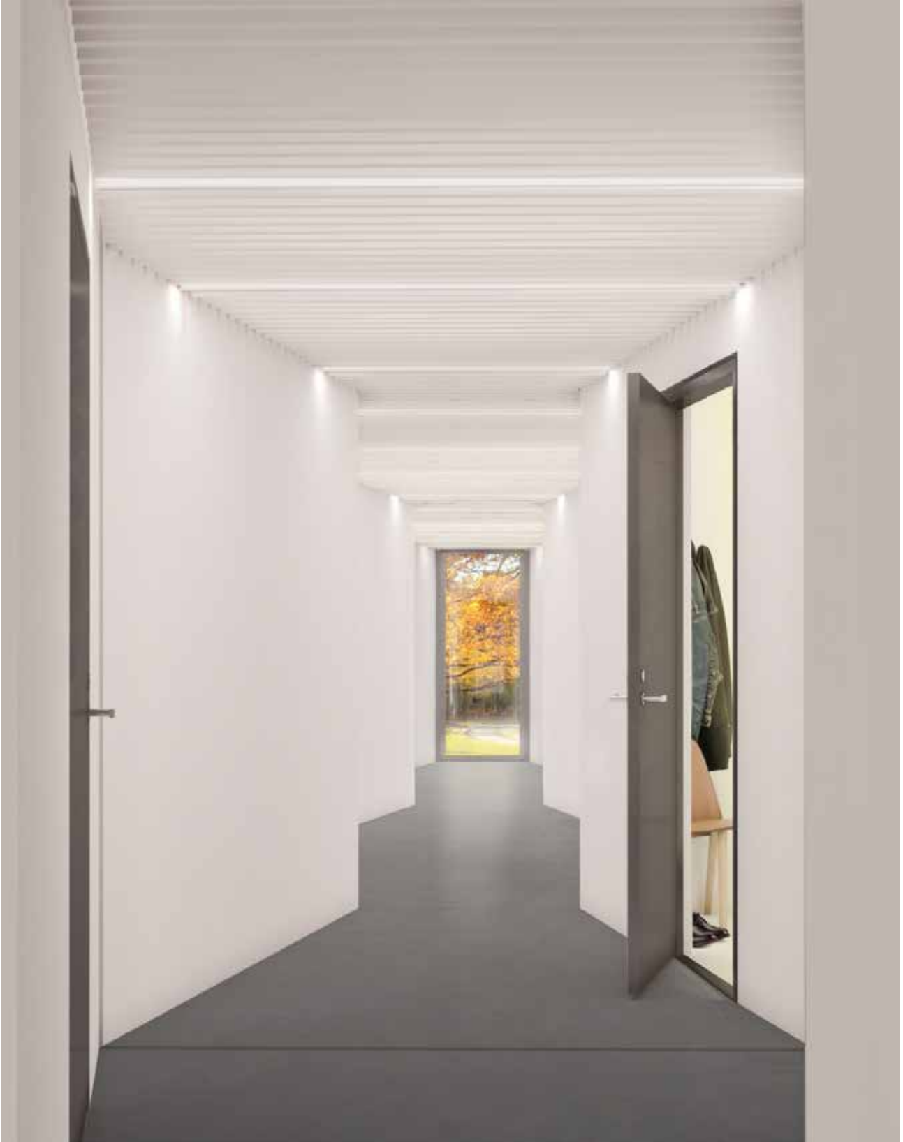
Korridor i en typ av boende med små energieffektiva lägenheter som Zenergy utvecklar för lansering april 2016.