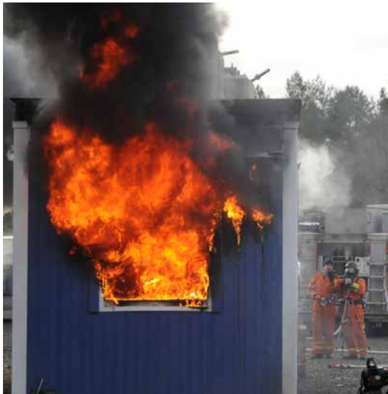
Brandtest i en Zenergy ZIP-Byggbodar.

Zenergy har utvecklat tre nya moderna bomoduler byggda med ZIP-Element, som lämpar sig väl för student-, asyl- eller entreprenadboenden för upp till fyra personer. Bomodulerna erbjuder flera flexibla lösningar som allrum och separat sovrum.