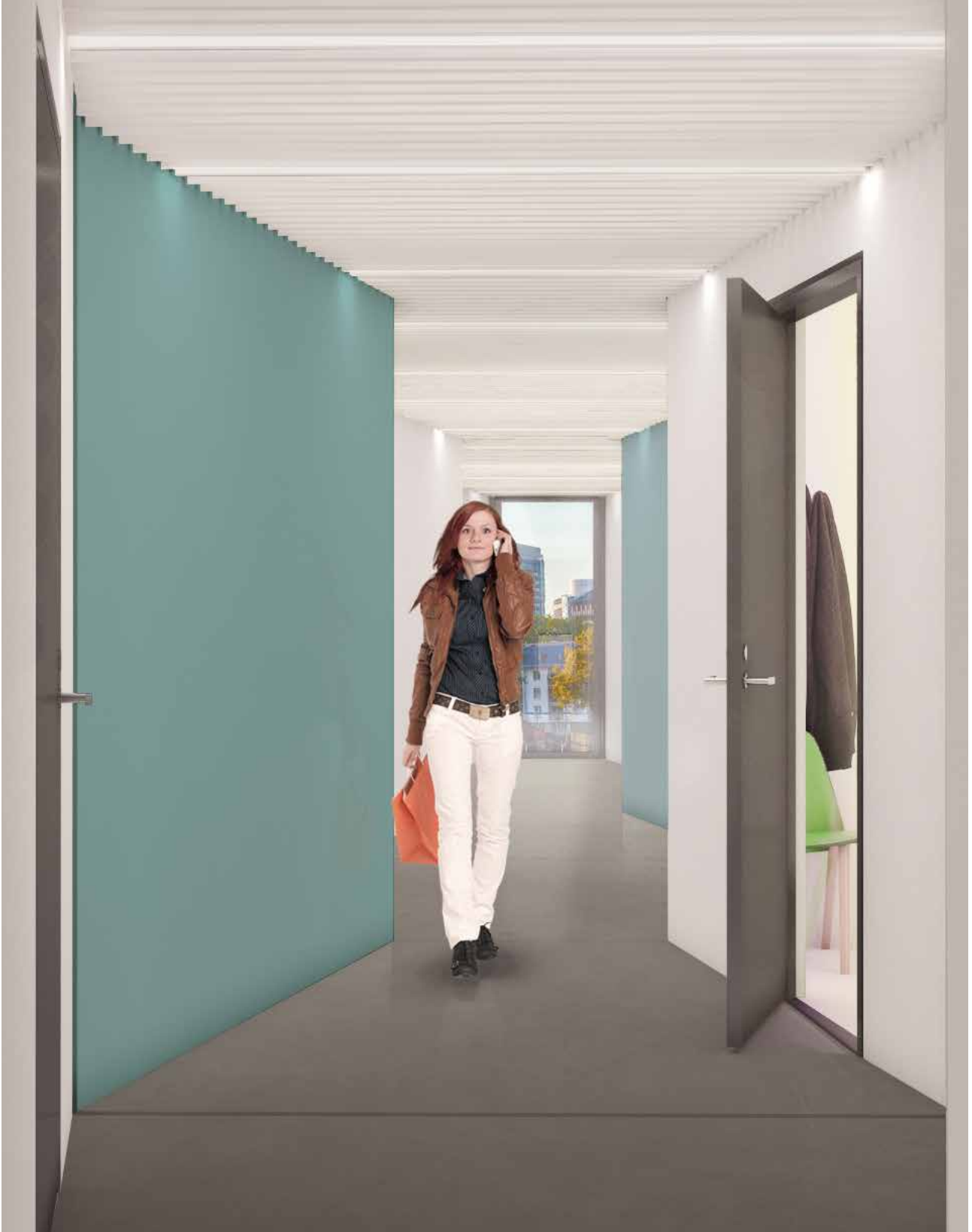
Korridor i en typ av boende med små energieffektiva lägenheter som Zenergy utvecklar för lansering april 2016.